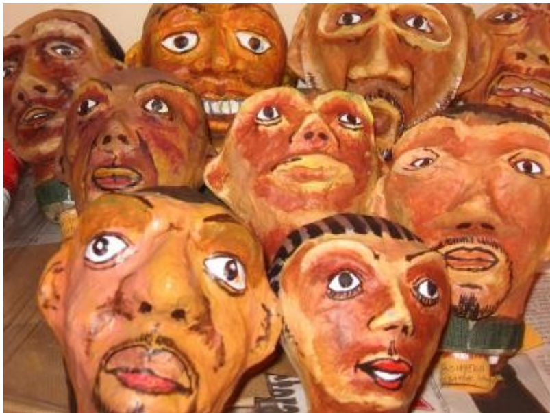
Marionettes fabriquées par la compagnie « Graine Théâtre », fondée par d'anciens élèves de l'Espace Masolo, pour leur spectacle « Oulala », mis en scène par Michelle Gauraz, 2007.

Certains stages sont animés par des jeunes qui, hier, étaient eux-mêmes enfants en formation à l'Espace Masolo. D'autres par des artistes confirmés congolais ou européens afin de favoriser une ouverture culturelle, une curiosité et une richesse de la dimension humaine de l'apprentissage.