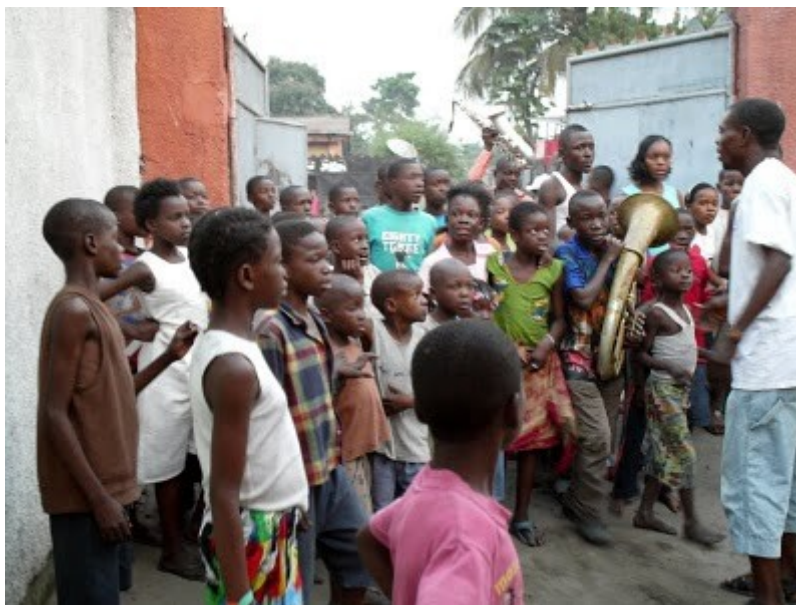
Les enfants du quartier arrivent à l'Espace Masolo, après une parade de la fanfare dans le quartier, 2010.

L'espace Masolo propose au public du quartier populaire environnant une dynamique culturelle d'animation et d'offre de spectacle théâtraux, musicaux... directement accessibles. Ce faisant, l'espace Masolo favorise la création de lien entre les habitants du quartier et les enfants des rues.