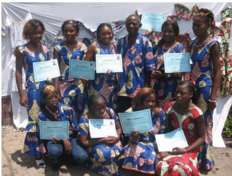
L'atelier Stylisme - Couture

La formation scolaire a pris une double forme, comme nous l'avons décrit plus haut. D'une part, le suivi scolaire, assuré par un enseignant congolais à l'Espace Masolo et d'autre part, la scolarisation de quelques jeunes dans un établissement classique en fonction de leur désir et de leurs capacités.