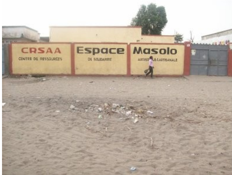
L'Espace Masolo à Kinshasa, 2008

Mais en 2008, l'Espace Masolo a été contraint de quitter les lieux sous la pression du propriétaire du terrain (augmentation induite du loyer, occupation du terrain à des fins privées par le propriétaire, etc...).