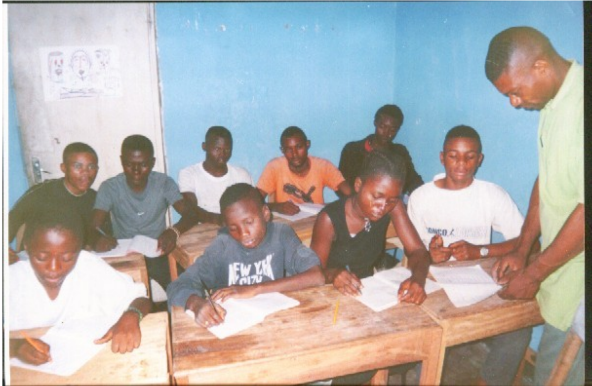
Une leçon à l'Espace Masolo, 2005