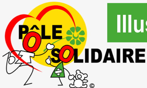
Illustration de l'organisation