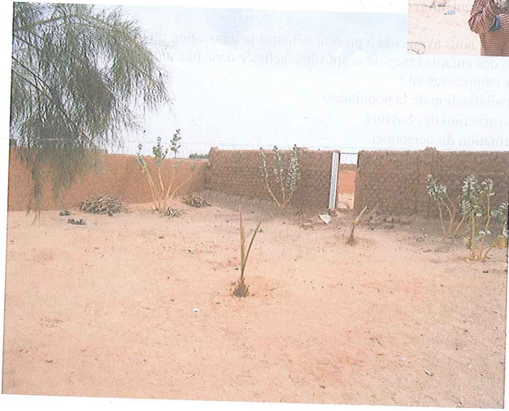
Terrain avec construction entouré d'un mur